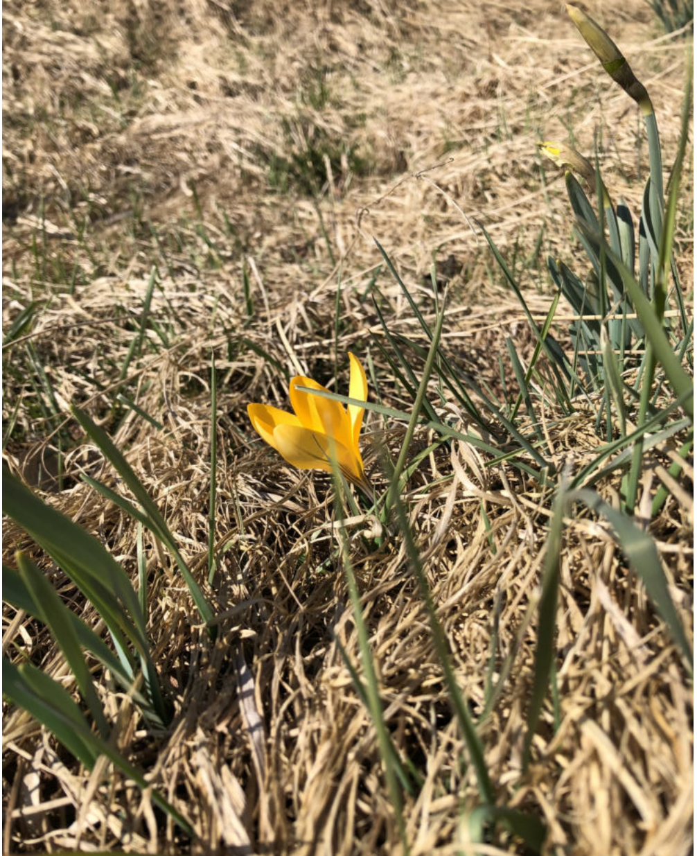
Frühlingsblume am Fahrradweg zwischen Wittlich und Neuerburg