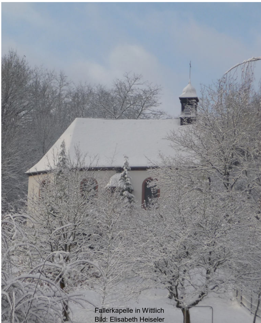
Fallerkapelle in Wittlich